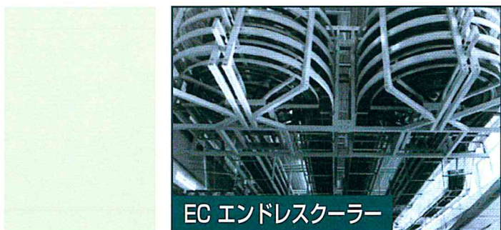
EC エンドレスクーラー