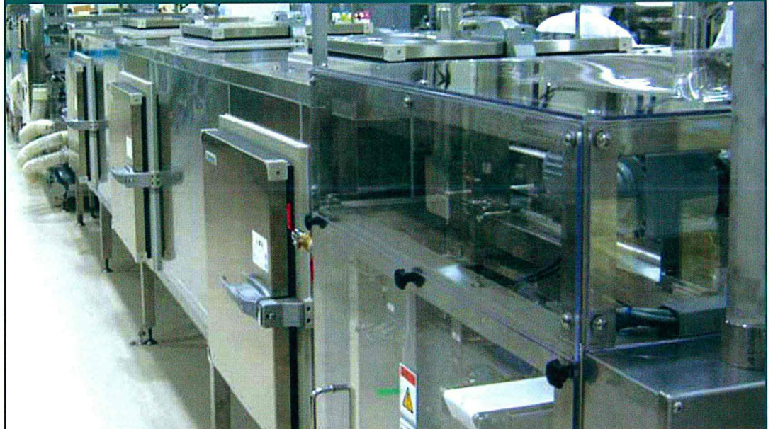
クーリング トンネル コンベヤ