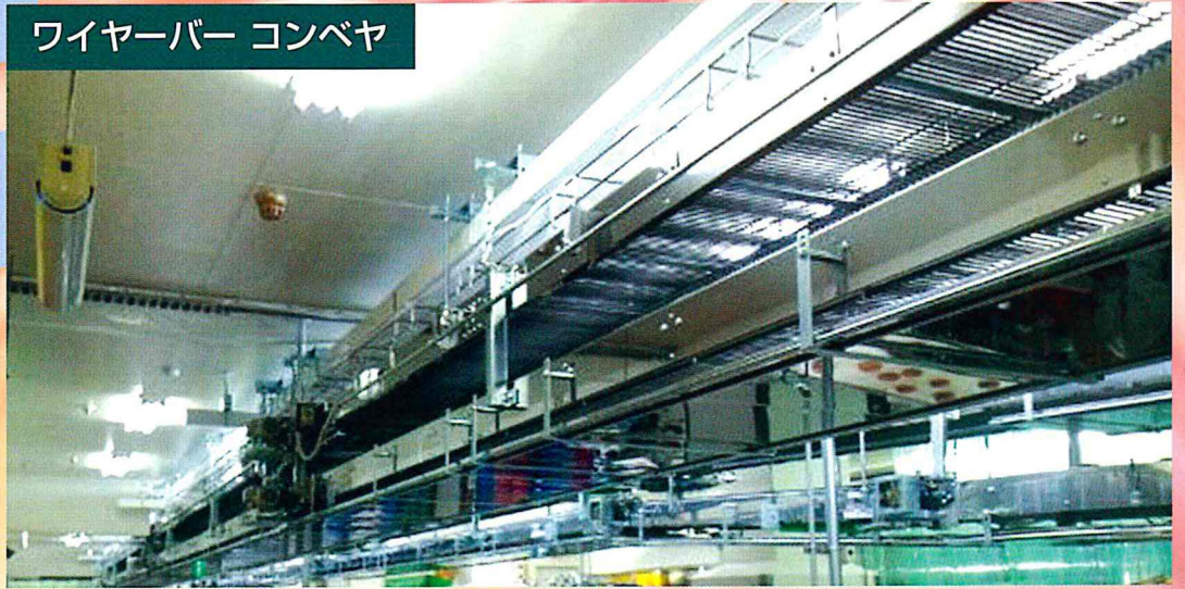
ワイヤーバー コンベヤ